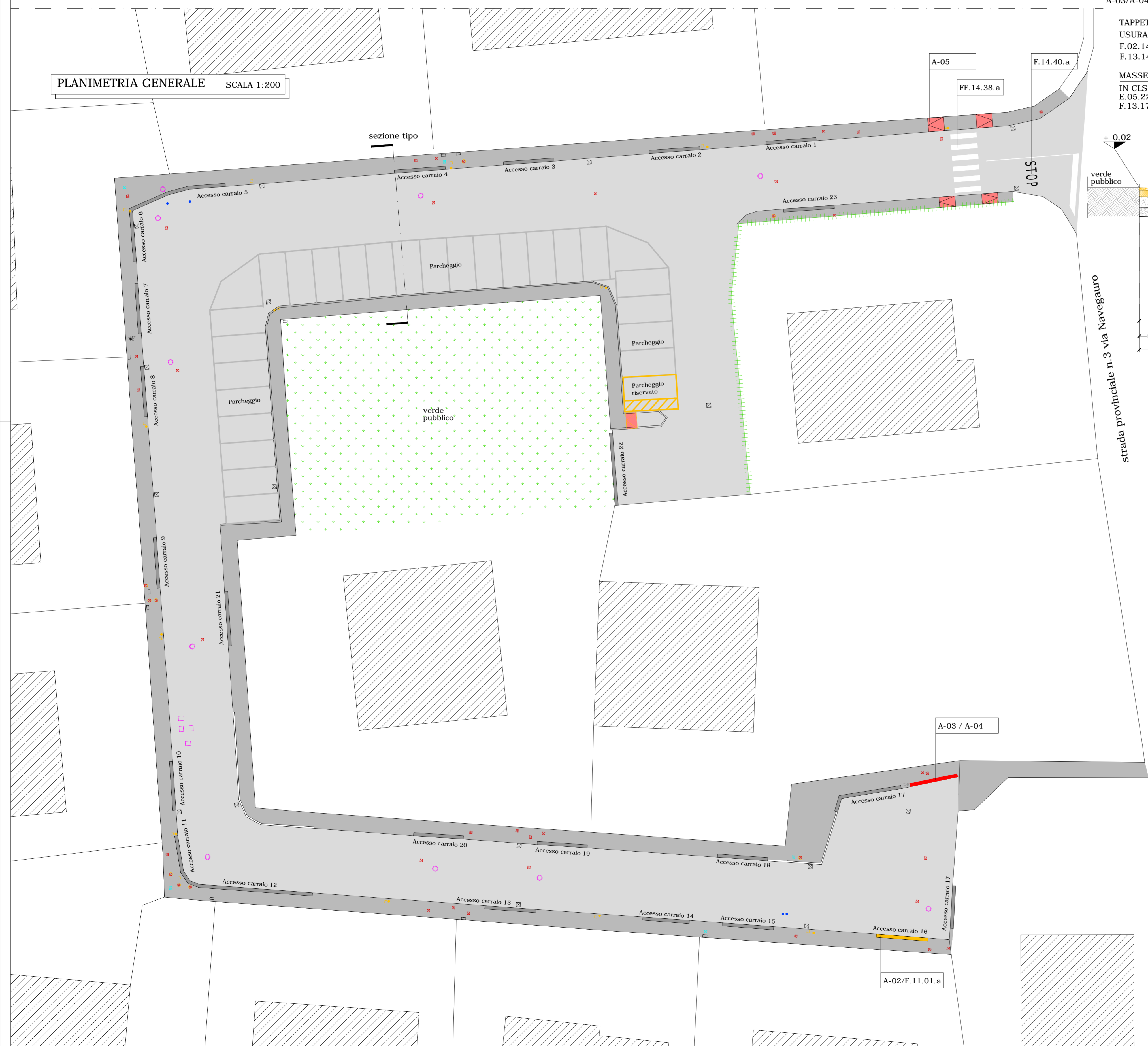
PLANIMETRIA GENERALE SCALA 1:200