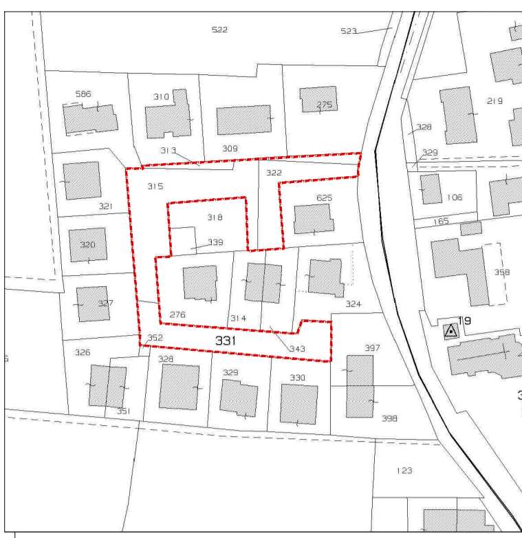
Foglio 6 - Mapp.131-315-322-331-