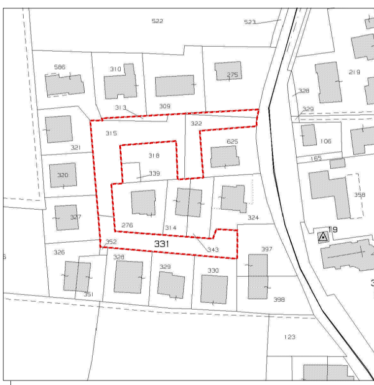
Foglio 6 - Mapp.131-315-322-331-