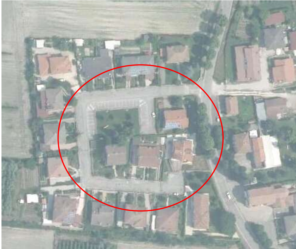
Ortofoto con individuazione area di intervento